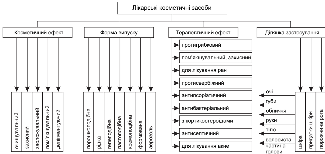
Рис. 1. Класифікація лікарських косметичних засобів